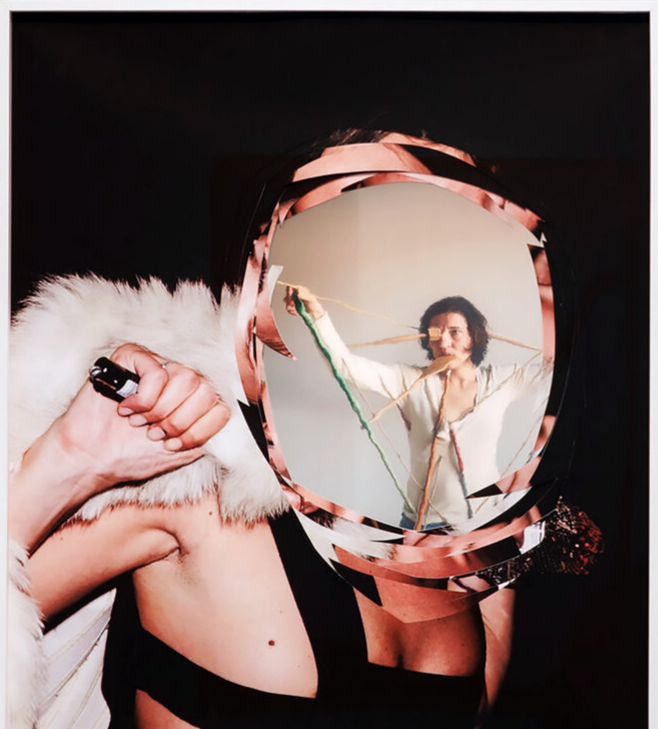
Herlinde Koelbl (2005) No. 0001 / Limited Edition, 2007 Photo collage / Photo collage Ac. 70 K8 Hardy (2007) No. 0001 / Limited Edition, 2007 Photo collage / Photo collage Ac. 70 Copyright Daniele Buetti