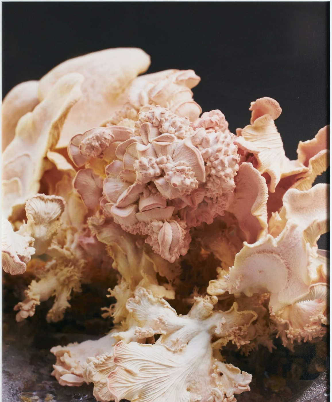
Abbildung: Magdalena Emmerig und Flo Maak Fruiting Bodies Pigmentdruck in Künstlerrahmen 59,4 x 42 cm 2022

Vernissage: Samstag, 19. März, 11 - 18 Uhr