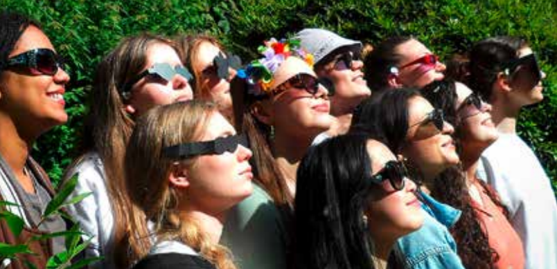
Der Kunstkurs im Sommerfeeling