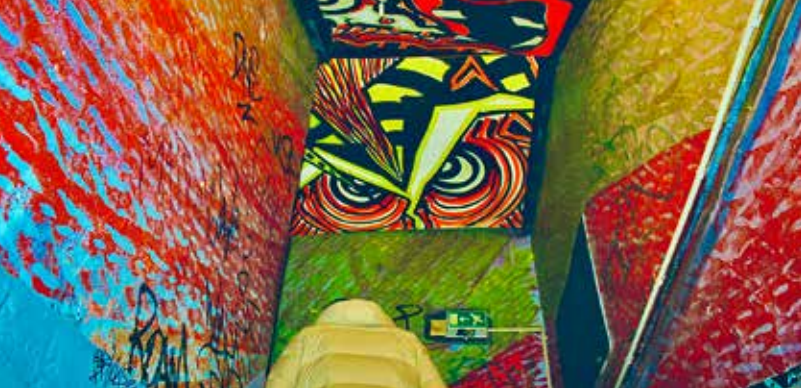
»Traum«, Thomas Spanidis