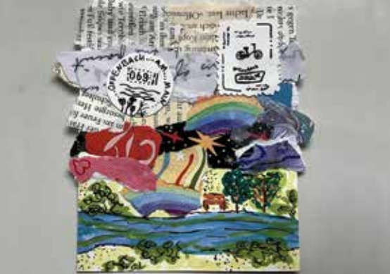
»Ort der Sehnsucht«, Sophie Azzalini