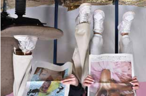
»ohne Titel«, Foto: Leonie C. Wirth

Öffnung: Freitag, 30. Juni 18 – 21 Uhr Vernissage Samstag, 1. Juli 11 – 18 Uhr | Sonntag, 2. Juli geschlossen