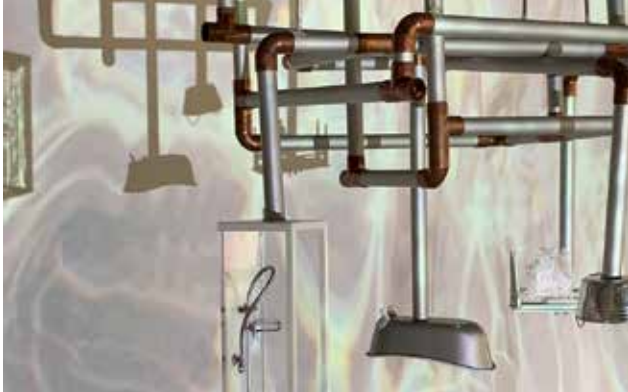
»Arnilla«, Stadt aus Rohren, Moritz Bockelmann